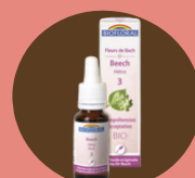
38 FLEURS DE BACH