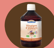
VINAIGRE DES 4 VOLEURS